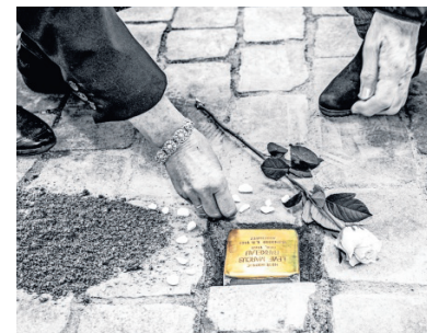
▲ In de Lange Vorststraat in Goes werden dit jaar twee struikelstenen geplaatst.

De provincie is het daar bij nader inzien mee eens. De stichting Struikelstenen werkt nu aan een tweetalige website om ook jongeren en jong-volwassenen te bereiken. De provincie is daar blij mee. Ze vindt educatie over de Tweede Wereldoorlog belangrijk.